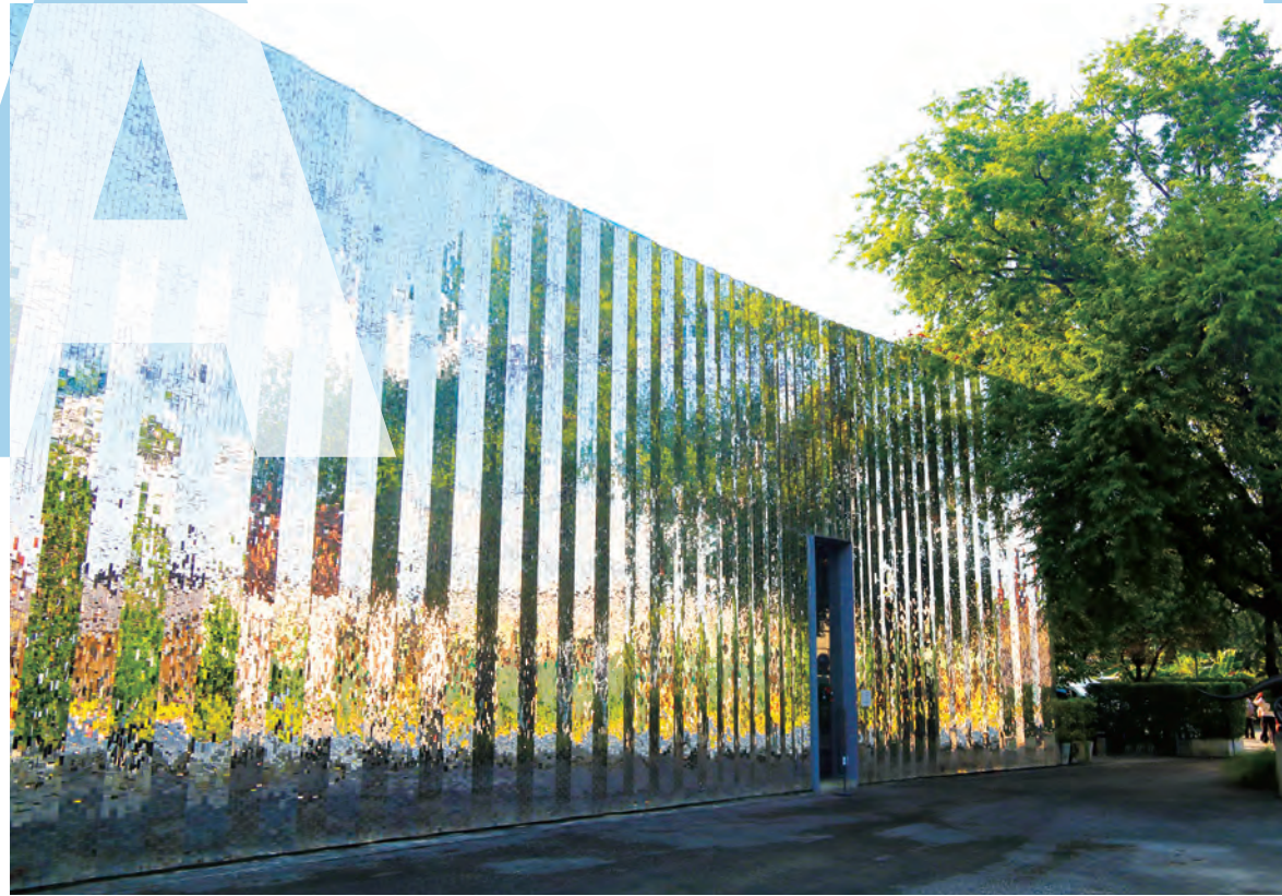
鏡で覆われた外観は周囲の風景を映し出すユニークなデザイン。