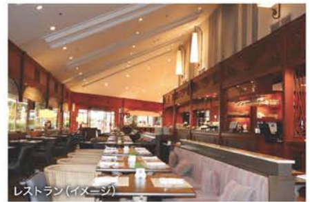
レストラン(イメージ)

パタヤ中心部の良い立地で、パタヤで人気のショッピングエリアやエンターテインメントエリアもすぐ近く。リゾートの魅力たっぷりで、リラックスできる空間と静寂があります。