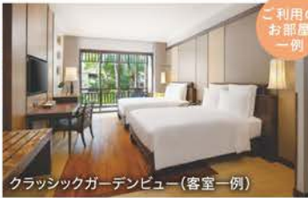
クラシックガーデンビュー(客室一例)