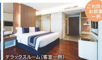
デラックスルーム(客室一例)