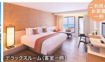
デラックスルーム(客室一例)