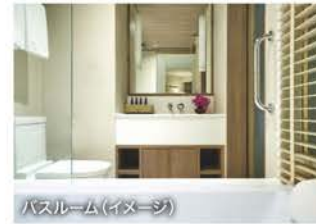
バスルーム(イメージ)