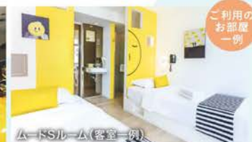
ムードSルーム(客室一例)