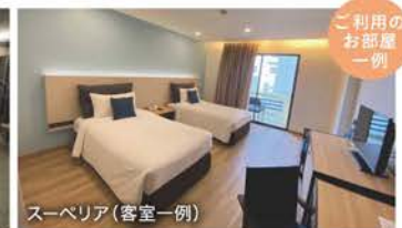
スーペリア(客室一例)