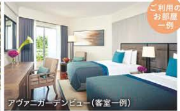
アヴァニガーデンビュー(客室一例)