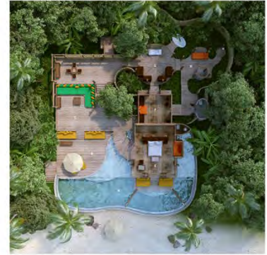
ビーチ・ プールヴィラスイート