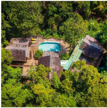
総面積 464m 2