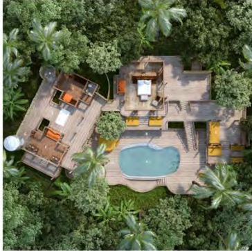
ベイビュー・プールヴィラスイート