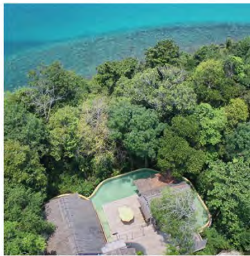
総面積 482m 2