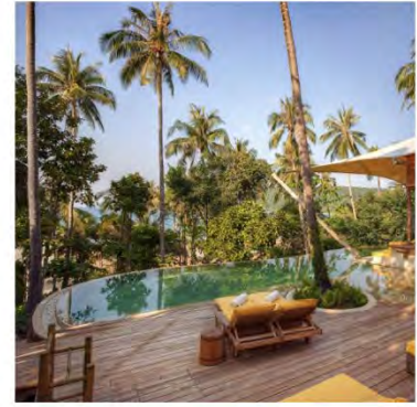
総面積 403m 2