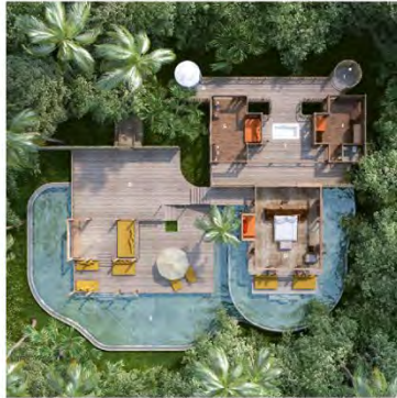
サンセット・オーシャンビュー・ プールヴィラスイート